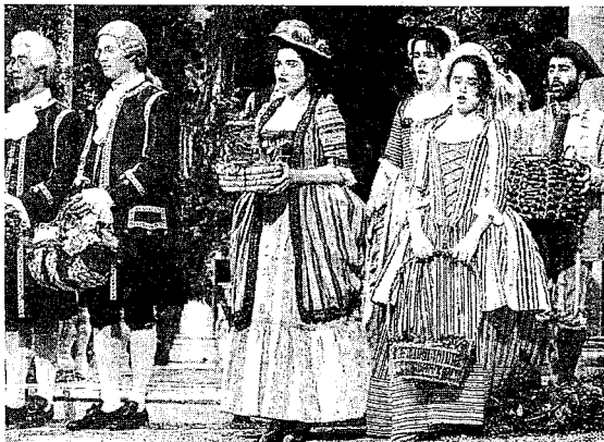
GRAN ÈXIT. «Una cosa rara» fou estrenada a Viena el 1786.