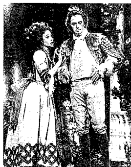
Un moment de «Una cosa rara», representada en València en 1992.