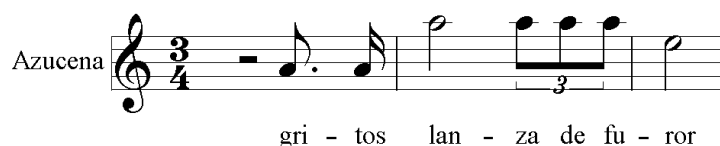
Figura 3: Salto de octava ascendente para enfatizar el significado de la letra

A través del diseño de la melodía el compositor refleja el significado de los versos. A continuación se puede apreciar la crispación que transmite la siguiente línea melódica que alcanza su punto álgido en el penúltimo compás con un La agudo precedido de un salto de octava ascendente coincidiendo con las palabras «lanza de furor»: