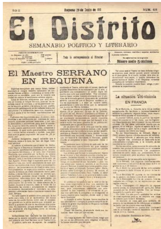
Imagen 10: El Distrito, Requena, 29-VI-1913.