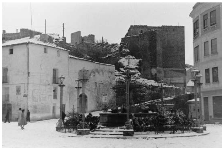
Imagen 2: Requena: Plaza del Portal y castillo al fondo (Foto Marcial García Cañabate, 1956).

Este trabajo trata sobre la difusión que la música de Serrano tuvo en un punto concreto de la geografía valenciana, Requena, ciudad que hasta 1851 había pertenecido a Cuenca.