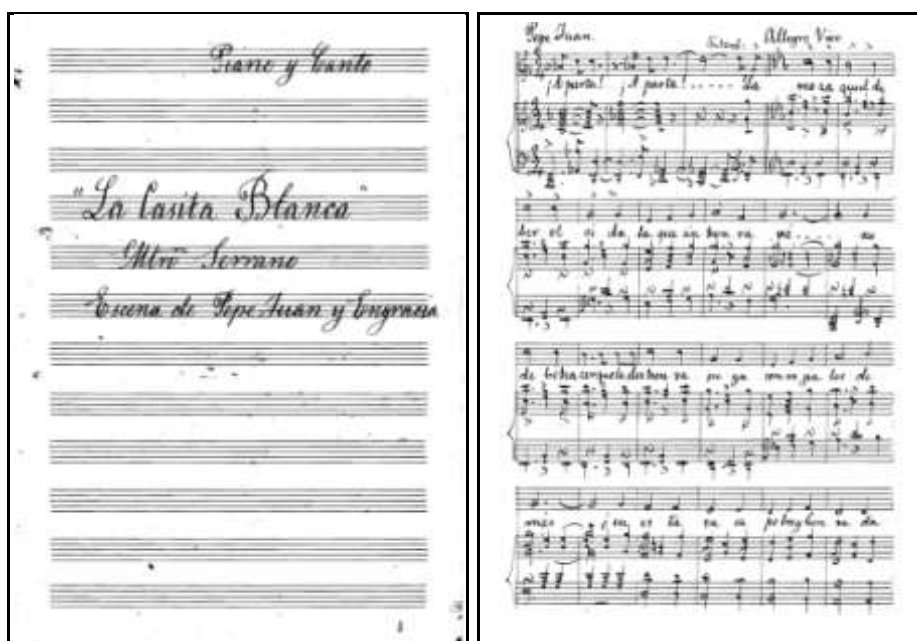
Imágenes 3 y 4: Reducción de piano de La Casita Blanca (Manuscrito de Mariano Pérez Sánchez, h. 1912).

Pérez Sánchez, siete años mayor que Serrano, es un ejemplo de generosidad hacia su compañero de profesión, al que admira sobremanera y lo expresa en la elección de sus obras y en las palabras que le dedica en la prensa local. El año anterior a su visita, en abril de 1912, ha dirigido La Casita Blanca a la compañía lírica de aficionados locales “Borrás-Gayarre”, en el Teatro Circo.