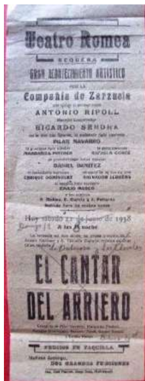
Imagen 16: Programa de mano del Teatro Romea (12-VI-1938).