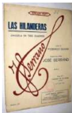
Imagen 15: “Canción de la Rosa”, de Las Hilanderas , para voz y piano.

Y es en ese año de reencuentros cuando vuelve a Requena José Serrano, quien al igual que en 1913, está “rodando” su nueva zarzuela, Las Hilanderas , antes de ir a Madrid.