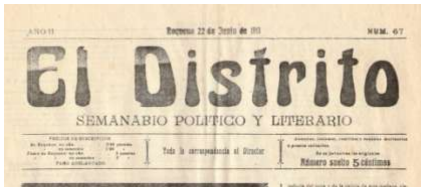
Imagen 5: Portada de El Distrito , Requena (22-VI-1913)

de la noticia y ensalzando al consagrado maestro de tan solo cuarenta años: