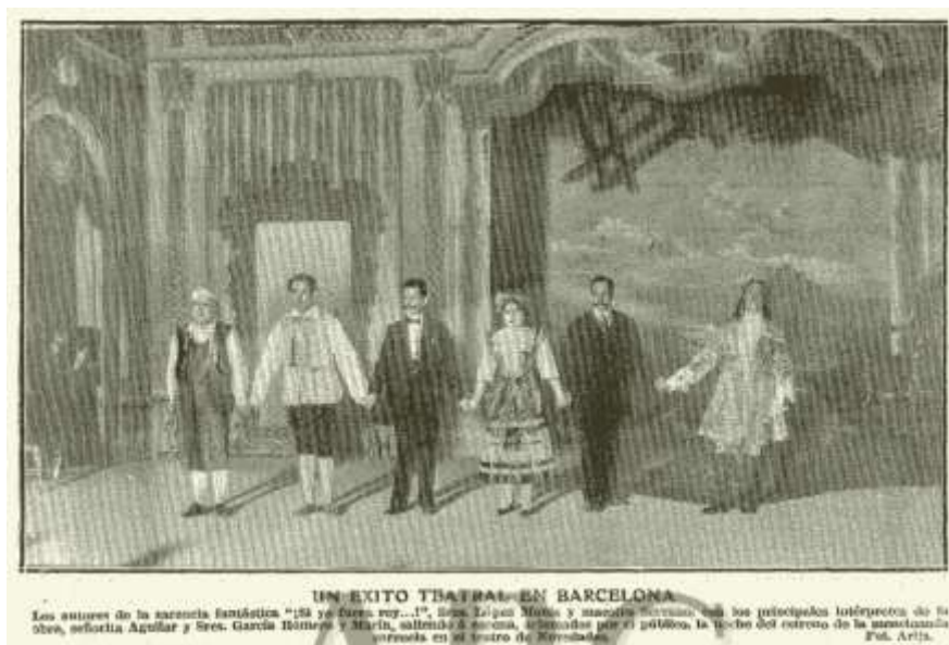
Imagen 7: Fotografía en ABC del estreno en Barcelona de ¡Si yo fuera Rey!

Esta zarzuela fantástica es la primera que José Serrano estrena fuera de Madrid, y no solo en Barcelona y Valencia, sino por toda la región valenciana. No será hasta el 17 de noviembre de 1913 que se presente en el centro del mundo zarzuelístico. Resulta pues, un privilegio para Requena que José Serrano represente su última zarzuela en la ciudad antes que en Madrid.