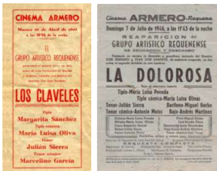
Imagen 18: Programas de Los Claveles y La Dolorosa , por el Grupo Artístico Requense (1945).

La Rondalla y Coros de Requena perduró hasta los años setenta del pasado siglo, manteniendo en repertorio fragmentos de zarzuela del maestro Serrano junto a obras de autores locales, otras zarzuelas y fragmentos de repertorio coral universal.