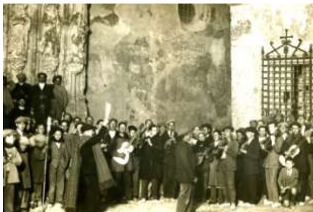
Imagen 13: Ronda de Mayos en Requena, hacia 1930.

La música de Serrano está presente en otro tipo de manifestación musical muy arraigado en Requena, el canto de los Mayos a las jóvenes, la noche del 30 de abril: