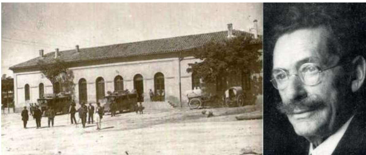
Imagen 11: Estación de Ferrocarril de Requena h. 1900 (Tarjeta Postal) y fotografía muy difundida del maestro Serrano.

Al partir el tren se sacó una instantánea.